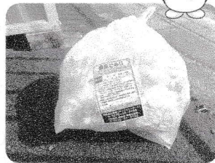
▲資源保管庫に出された違反ごみ